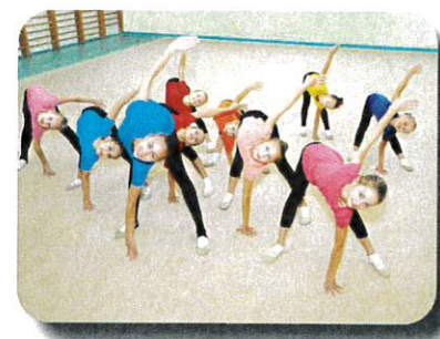
Tanz und Akrobatik