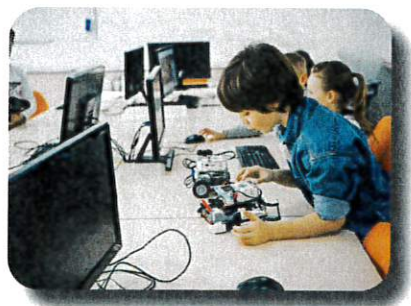
Coding und Robotik