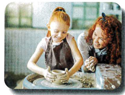
Forschen und Entdecken